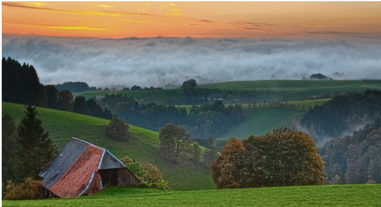
Mehr Schwarzwald geht nicht: Das 1000 Meter hoch gelegene Klosterdorf St. Märgen liegt in einer Bilderbuchlandschaft.

Vertrauen ist auch die Grundlage dafür, dass es im „Café Goldene Krone“ läuft: Hier ziehen gleich fünf Powerfrauen an einem Strang, äh: Backblech. Jeden Morgen um vier schmeißt das Frauenkollektiv die Öfen an, denn am Ende sollen außer der obligatorischen Kirschtorte 15 weitere Kuchen die Vitrine