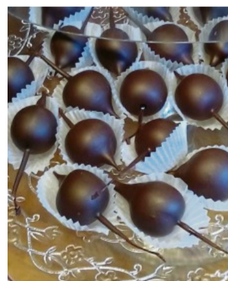
Zum Anbeißen: Handgefertigte Schwarzwälder Stielkirschen.